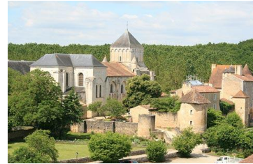
Abbaye de Nouaillé-Maupertuis