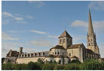
Abbaye de Saint-Savin