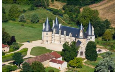
Château de Magné