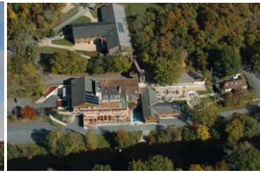
Base FFCT de Lathus